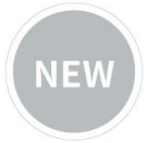
新产品—单轴半挂车